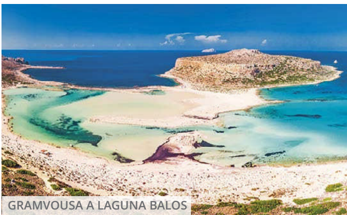
GRAMVOUSA A LAGUNA BALOS